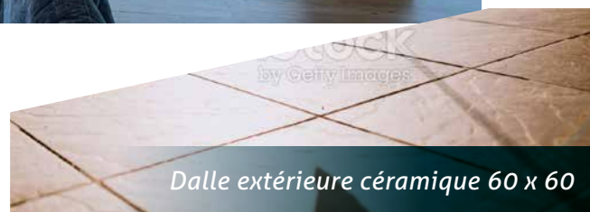
Dalle extérieure céramique 60 x 60